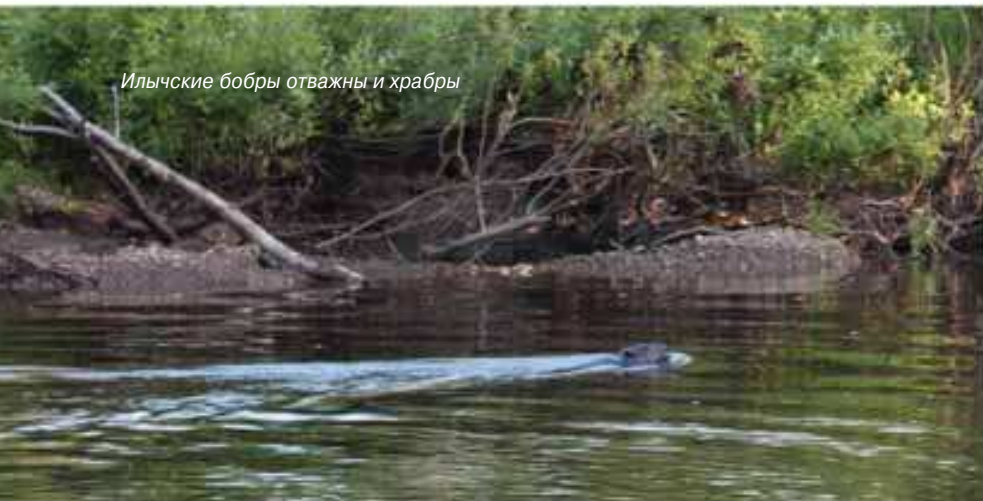
Илычские бобры отважны и храбры