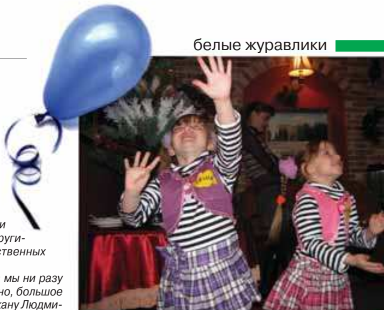
Чаша добра не может переполниться от хороших пожеланий!