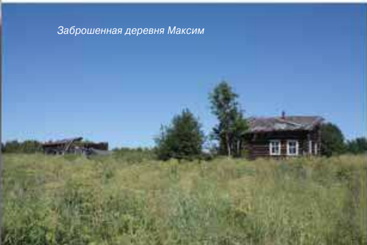
Заброшенная деревня Максим

Пять дней нашего пути, до самых границ Печоро-Ильчского заповедника, не встречали мы на реке людей. А те, что встретились нам на кордонах и в поселках, достойны отдельного рассказа. Вот третий кордон –