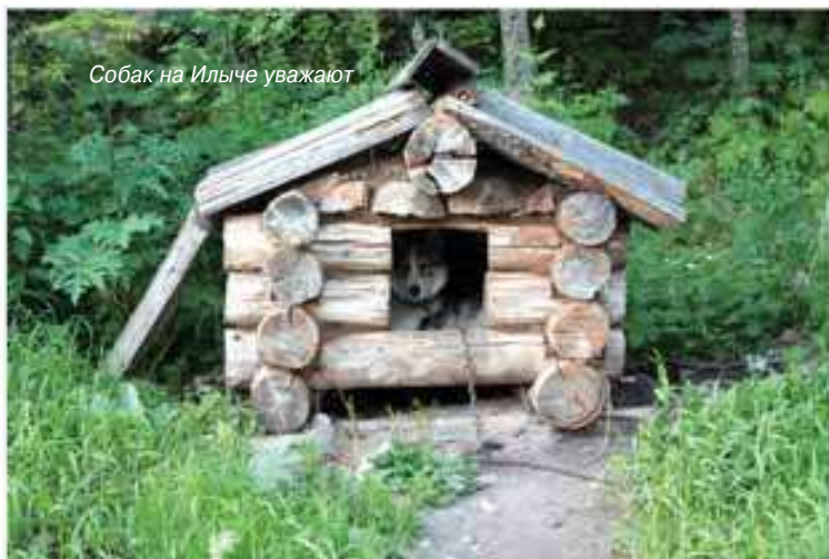
Собак на Ильче уважают